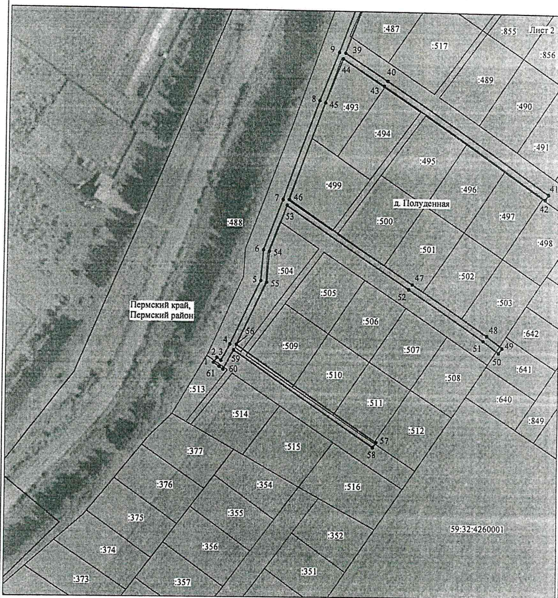
Схема расположения границ публичного сервитута объекта