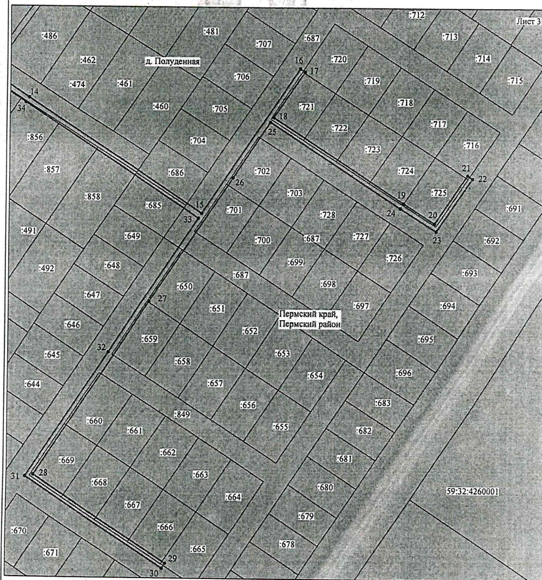
Схема расположения границ публичного сервитута объекта